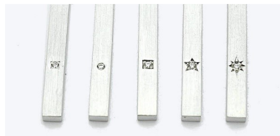
メレ彫り留め 1PCあたり ¥2,000 (左から4点、覆輪、マス、星、後光留め)