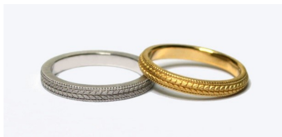
ミル打ち(1列あたり、CADは無料) ¥10,000 ※CADを使った模様リングは幅3mmから制作、幅を細くしても金額は同じ。