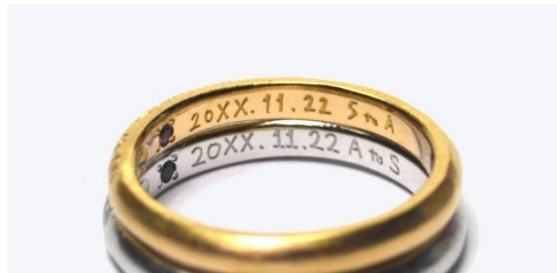
内側のレーザー刻印 10文字まで ¥5,000 11文字以降は1文字あたり¥500 ※オーダー結婚、婚約指輪特典として付いています。