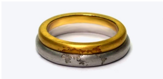
外側のレーザー刻印 (1本あたりの金額) ¥15,000