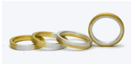
コンビ加工 一部 ¥10,000 半分 ¥15,000 上下 ¥30,000 内外 ¥30,000