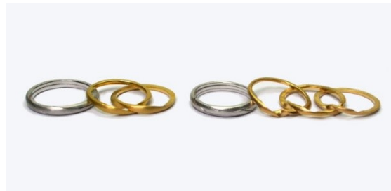
2連ギメル ¥30,000 3連ギメル ¥60,000